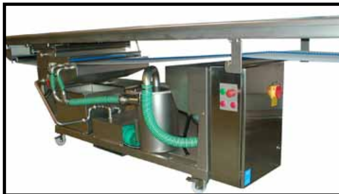
Dispositif optionnel de nettoyage du convoyeur

Le convoyeur d'assemblage de sandwichs Grote est une unité en inox conçue pour l'acheminement des sandwichs sur la longueur requise. La courroie supérieure est fixée à une hauteur de travail nominale pour accommoder les processus d'assemblages de sandwichs manuels ou automatiques. Le lit supérieur en acier inoxydable comporte des canaux continus le long des deux côtés du convoyeur, créant ainsi des espaces idéaux pour placer les ingrédients du sandwich, à chaque poste de travail de l'opérateur. Les courroies sont totalement réglables pour corriger l'alignement et maintenues sous tension du côté inoccupé. Une simple commande manuelle de débrayage du côté inoccupé permet de relâcher la courroie pour faciliter l'accès pour nettoyage et séchage. La vitesse de la courroie est réglable électriquement, en mode manuel ou automatique.