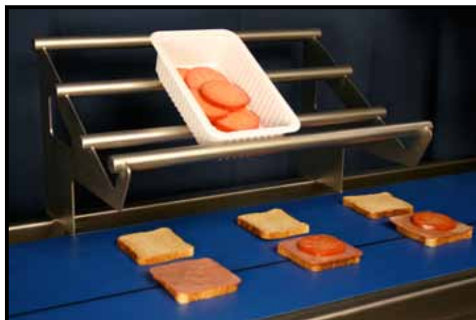
Racks-plateaux à ingrédients auto-positionnants optionnels

Le convoyeur d'assemblage de sandwichs Grote peut être personnalisé avec plusieurs accessoires optionnels, dont un système CIP (Clean In Place)/de lavage de courroie. Le système CIP permet le lavage et le séchage en continu de la courroie pendant la production, et s'enlève facilement pour le nettoyage et la désinfection. En outre, le convoyeur peut être équipé de racks auto-positionnants qui peuvent être placés n'importe où sur sa longueur. Ces racks sont capables de supporter des conteneurs d'ingrédients pesant jusqu'à 27kg et peuvent être placés à côté d'une station de travail ou en porte à faux au-dessus de la courroie.